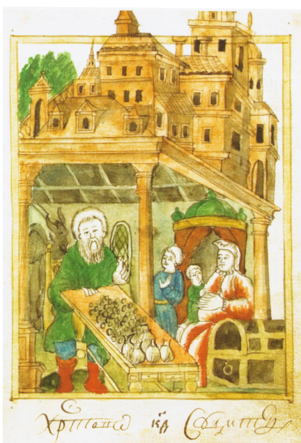
1. Дьявол поучает роскошника. Миниатюра Синодика Сольбинской Никольской пустыни. Л. 16 The devil teaches a spendthrift. Miniature of the Synodic of St Nicholas Monastery of Solba. P. 16

Illustration for the article: Liudmila Sukina. The Condemnation of Avarice as "Demonic Instigation" in the Illustrations of Synodics of the Early Modern Period