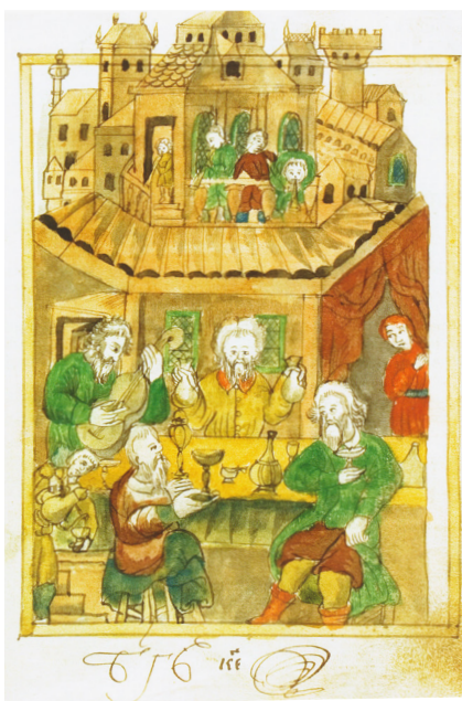
2. Пир в доме роскошника. Миниатюра Синодика Сольбинской Никольской пустыни. Л. 17 A feast in a spendthrift's house. Miniature of the Synodic of St Nicholas Monastery of Solba. P. 17