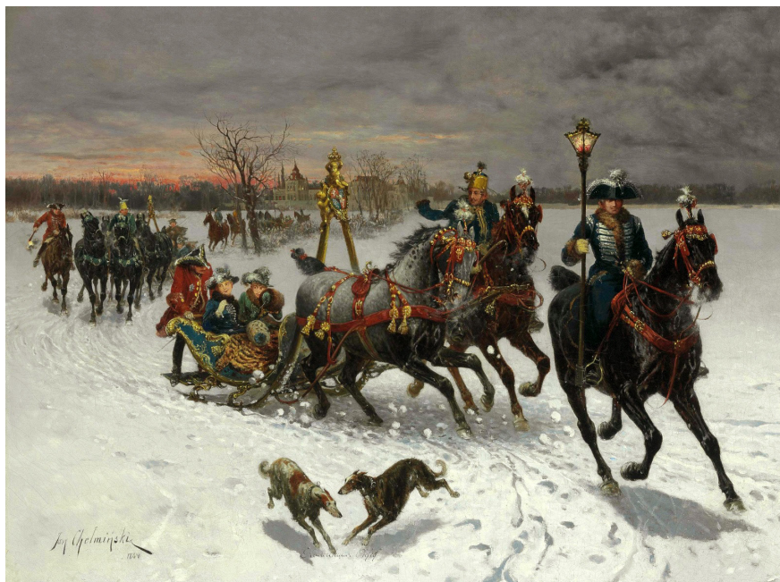
2. Я. Хельминский. Покидая замок. 1884 J. Chelminski. Leaving the Castle. 1884