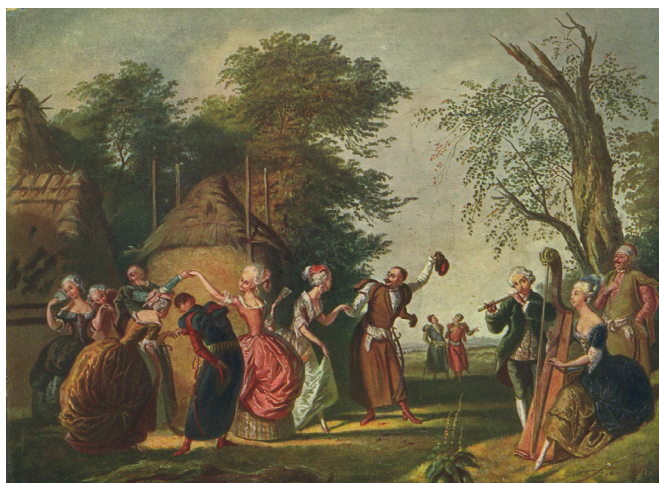
1. К. Шлегель. Полонез под открытым небом. 2-я половина XIX в.

Illustration for the article: Tomasz Ciesielski . Celebrations at the Royal Court and Their Reception in the Festive Life of the Polish-Lithuanian Commonwealth