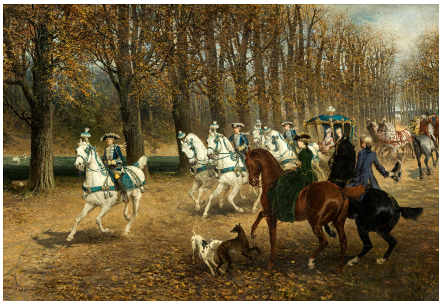
3. Я. Хельминский. Поездка эlegantных господ в экипаже. 1883 J. Chelminski. Carriage Ride of an Elegant Society. 1883