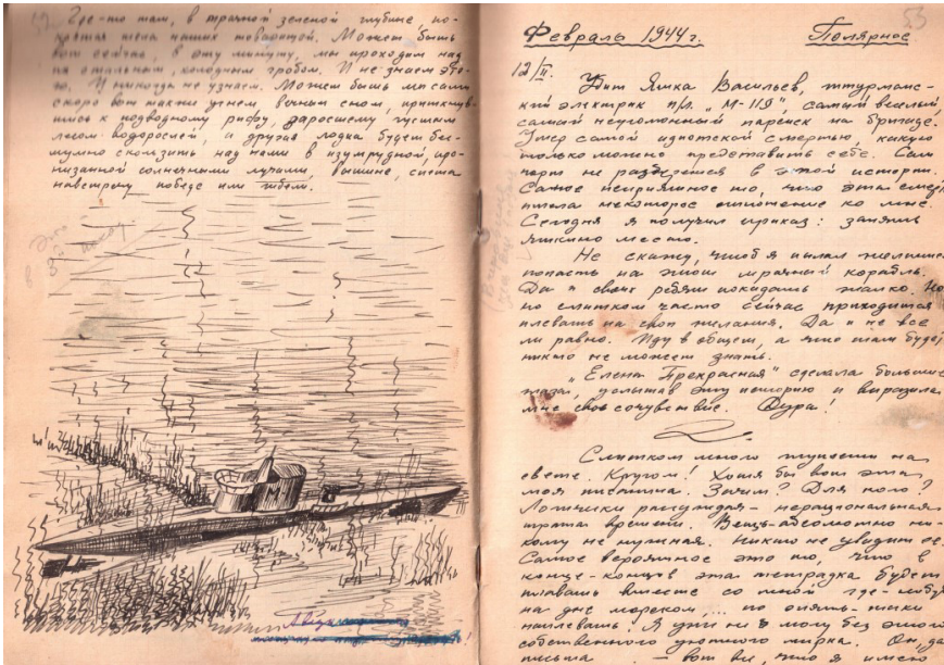
Страницы из фронтового дневника Г. И. Сенникова. 1943–1944. Рисунок «Лодка на дне»

Illustration for the article: Yekaterina Postnikova, Viktoriya Volkova. This is my world: a submariner's battlefield diary