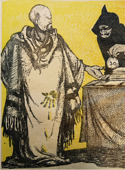
5. Дени. Верная служба – честный счет // Бич. 1917. № 28 Deny. Faithful service – honest account // Beach. 1917. № 28