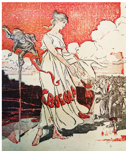
4. «Шло ликование в народе...» // Пугач. 1917. № 14. Обложка "There was jubilation among the people..." // Scarecrow. 1917. № 14. Cover