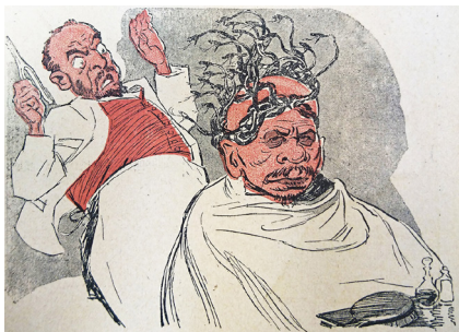
9. Завивка «большевика» // Барабан. 1917. № 4. С. 7 Curling "Bolshevik" // Drum. 1917. № 4. P. 7