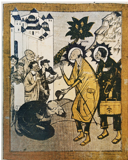
11. Синус. Сретение неподобных великомучеников большевистских Ленина и Зиновьева // Бич. 1917. № 26 Sinus. The Meeting of Unworthy Great Martyrs of Bolshevik Lenin and Zinoviev // Beach. 1917. № 26