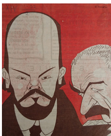
13. Д. Моор. На двух полюсах. Два казака – пара // Будильник. 1917. № 37–38 D. Moor. At two poles. Two Cossacks – pair // Alarm clock. 1917. № 37–38.