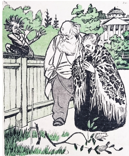
8. Ре-Ми. Семья не без урода // Новый Сатирикон. 1917. № 24. Обложка Re-Mi. Family is not without a freak // New Satirikon. 1917. № 24. Cover