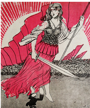
3. Д. Мельников. Вперед! Только русские штыки принесут свободу германскому народу! // Будильник. 1917. № 19 D. Melnikov. Let's go! Only Russian bayonets will bring freedom to the German people! // Alarm clock. 1917. № 19