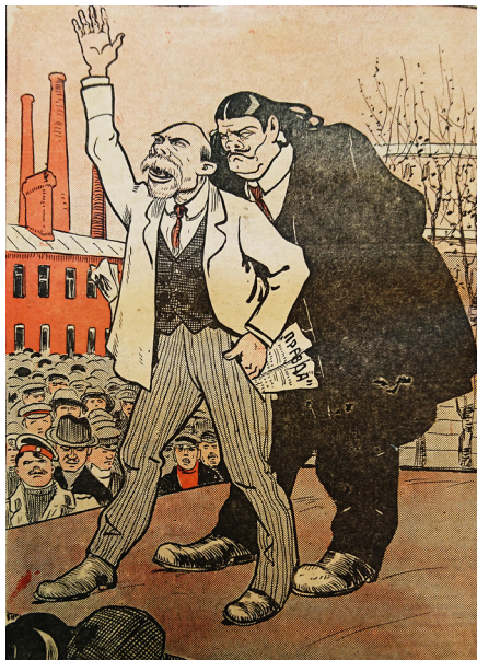
10. «Долой дисциплину! Мир без аннексий и контрибуций!» // Пугач. 1917. № 6 "Down with discipline! A world without annexation and counteraction!" // Scarecrow. 1917. № 6