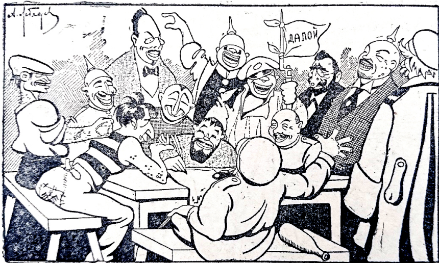
1. А. Лебедев. Пишут «Приказ № 1» // Стрекоза. 1917. № 32. С. 14

в карикатуре «Пишут „Приказ № 1“» (ил. 1). На его рисунке одними из авторов приказа № 1 оказывались отсутствовавшие тогда в России В. И. Ульянов и А. В. Луначарский, причем Ленин изображался монголоидом с торчавшей из головы пикой от немецкого шлема.