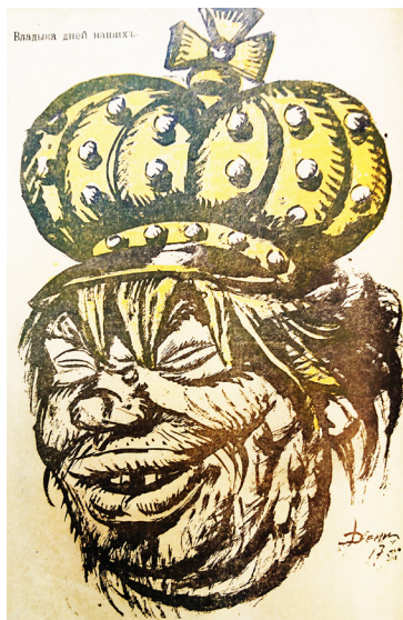
12. Дени. Владыка дней наших // Бич. 1917. № 38 Deny. Lord of our days // Beach. 1917. № 38