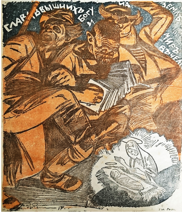
14. Ре-Ми. Рождество Христово 1917 // Новый Сатирикон. 1917. № 45 Re-Mi. Christmas 1917 // New Satirikon. 1917. № 45