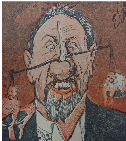
2. Между властью и анархией // Барабан. 1917. № 10. Обложка Between Power and Anarchy // Drum. 1917. № 10. Cover