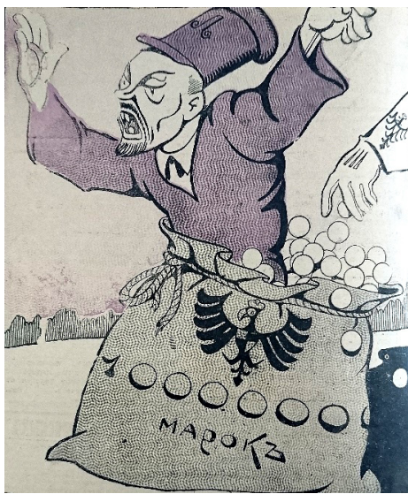
2. Ленин-пролетарий, или Шило в мешке // Стрекоза. 1917. № 30. С. 14

Среди образов Ленина-немца можно выделить две концепции: «патриотическую», при которой Ленин оказывался немцем, искренне