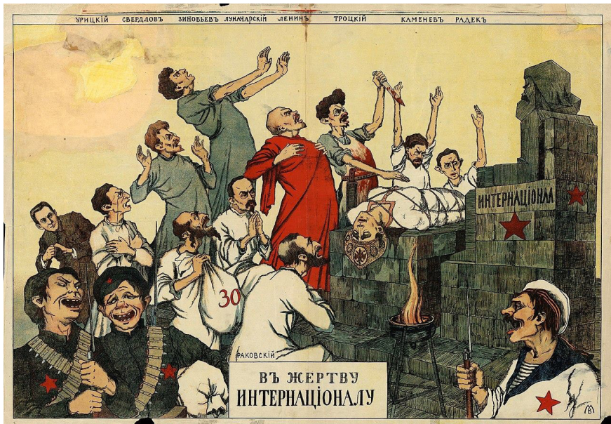
15. В жертву Интернационалу. Плакат. 1918–1922 A sacrifice to the International. A poster. 1918–1922