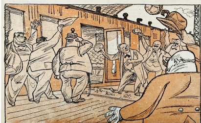
1. Ре-Ми. Все совершенствуется // Новый Сатирикон. 1917. № 15. С. 16 Re-Mi. Everything is improving // New Satirikon. 1917. № 15. P. 16