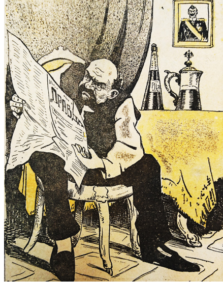
6. Ленин за своей газетой // Пугач. 1917. № 13. С. 14 Lenin with his newspaper // Scarecrow. 1917. № 13. P. 14