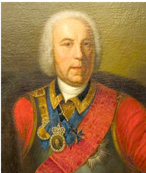
1. Неизвестный художник. Портрет В. де Геннина. XVIII в.

На сегодня возможно полагать установленным, что человек, ставший известным в России как Вилим Иванович Геннин, происходил из незнатной семьи, ряд представителей которой получили известность в XVII в. как деятели просвещения и проповедники в Голландии и в западных германских герцогствах и графствах. Дед В. Геннина Конрад Геннин, получив университетское образование, был священником в Дилленбурге, затем в Зигене, а впоследствии придворным проповедником и инспектором реформатской церкви в Ганау. Дядя, Генрих Геннин ( Heinrich Christian Henning ) (1658–1704), окончил в 1679 г. университет в Утрехте со степенью доктора медицины, впоследствии состоял ректором гимназии в голландском городе Тиле, а в 1690 г. стал ординарным профессором в университете Дуйсбурга (ил. 1).