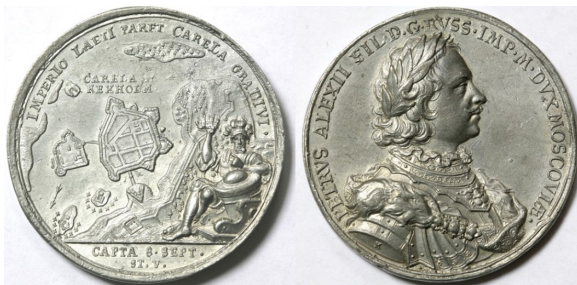
3. Медаль в память о взятии Кексгольма. 1710

И хотя, согласно архивному документу, пожалование «мызы Азила» В. Геннину имело место вовсе не сразу после падения Кексгольма, а в 1714 г. [РГАДА. Ф. 9. Отд. 2. Кн. 48. Л. 468 об.], существа дела это не меняло. Тем более что в 1714 г., вероятнее всего, состоялось уже юридическое оформление пожалования, когда Вилиму Геннину были выданы правоустанавливающие документы.