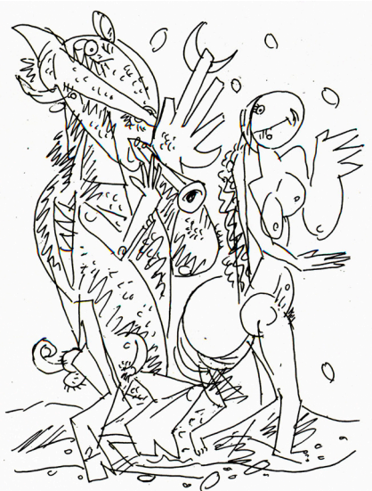
2. В. Волович. Влюбленный монстр

В альбоме откровенно раскрывается, выразительно звучит и вторая ключевая сторона и основа эротики – сексуальное желание, властный зов биологической, телесной природы человека. Именно желание делает объект эротического искусства чувственным, соблазнительным и эстетичным. Желание создает особую его атмосферу, температуру, напряженность (интенсивность) эмоционально-волевого начала, энергетическую насыщенность, общую тональность и экспрессивность художественной ткани, что можно иллюстрировать листом из одного из последних разделов альбома «Леда и лебедь» (ил. 3).