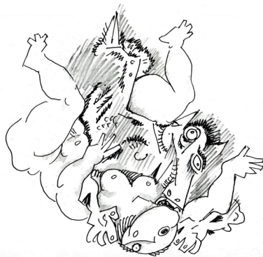
4. Без названия

Вернемся к заданному в начале статьи вопросу: отчего при поразительной объективности, приемлющей доминанте и полифонии