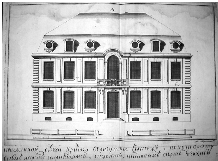
1. Гравюра А. И. Ростовцева по чертежу Ж. Б. Леблona. Проект «образцового дома для именитых». Надпись внизу: «Присланный от его царского величества чертежъ, по которому всем на реку строящимся строить таковым образомъ эизхт»

Наибольшее распространение получил проект «образцового дома для именитых», посланный Леблоном Петру I в момент путешествия императора во Францию (ил. 1). При получении Петр I велел сделать с него копию и направил обратно для осуществления (18–29 апреля) [Мезин, с. 63].