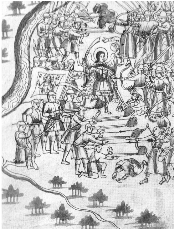
2. С. У. Ремезов. Бой у урочища Березовый Яр. Иллюстрация Ремезовской летописи. Библиотека Академии наук. ОР. 16. 16.5. Л. 10

По углам каймы знамени расположены четыре цветочных розетки-медальона, на боковых каймах – срезанные ветви с крупными плодами и бутонами, на нижней кайме – аналогичный мотив, вытянутый по вертикали. Подобного рода срезанные ветви, вытянутые по вертикали по краю листа, встречаются, например, на рукописном листе Титулярника 1672 г. 11 или на гравированной заставке-рамке титульного листа Леонтия Бунина для книги «Луцидариус, или Златый бисер» (не позднее 1696 г.) [Хромов, с. 54]. Близким примером оформления центральной сцены орнаментальной рамкой из подобных ветвей служит гравированный лист Л. Бунина и А. Трухменского в книге «Страсти Христовы» 1691 г. [Хромов, с. 58].