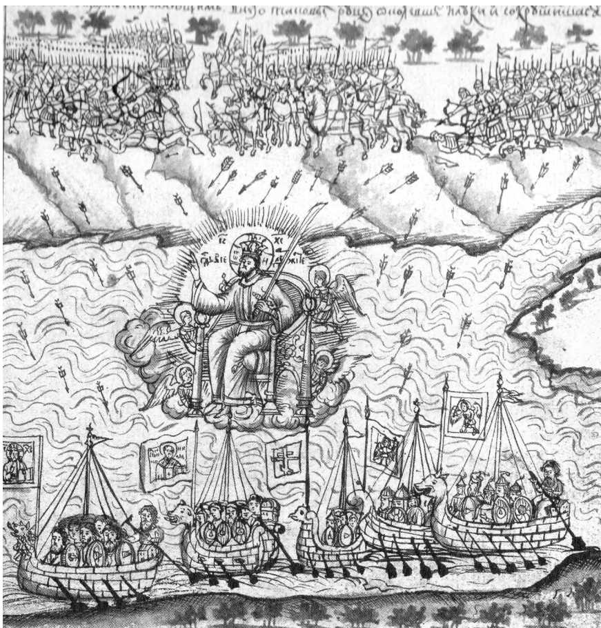
3. С. У. Ремезов. Явление Христа над судами Ермака. Иллюстрация Ремезовской летописи. Библиотека Академии наук. ОР. 16. 16.5. Л. 12