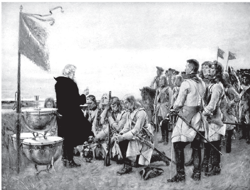
1. Густав Сёдерстрём. Причастие в шведских войсках. XIX в.

Многочисленная – около тысячи человек, тобольская колония пленных офицеров, их жен, детей и слуг постаралась, насколько это было возможно, создать привычный культурный ландшафт и комфортный образ жизни. Прежде всего была налажена религиозная жизнь офицеров-лютеран. Находясь в православной столице Сибири, шведы старались сохранить свою религиозную традицию. Первые два года привычные к полевым условиям военные проводили службу прямо под открытым небом, вероятно, все-таки надеясь, что они не-